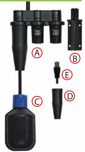
US Pat. 9,559,455 and 9,583,867. Foreign Patents Pending.